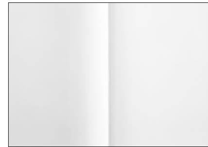
Anzeige 2/1 B: 426 x H: 305 mm

Bunddoppelung DS Anzeige im Innenteil: 3 mm Bunddoppelung DS Anzeige U2/S.3: 5 mm