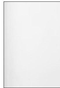
Anzeige 1/1 B: 213 x H: 305 mm

Data: Print profile: X3:2002 PSO coated v3, 51L, 300 dpi Bleed margin: 5 mm